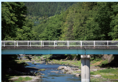
佳月橋 (かげつきょう)

表紙は、佳月橋の下から撮影したものです。佳月橋からの風景も秋川渓谷を代表する風景のひとつです。