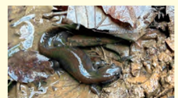
トウキョウサンショウウオ

にも、水場を大切にす、針葉樹の植林から生物多様性を高める森林への転換、自然のバランスを崩す外来種やシカの対策なども強化しなければ、トウキョウサンショウウオの話だけにかかわらず、自然全体の更なる悪化に繋がります。その悪化に伴い、我々人間の世界にもさまざまな形で被害がはね返ってくると思います。(パブロ)