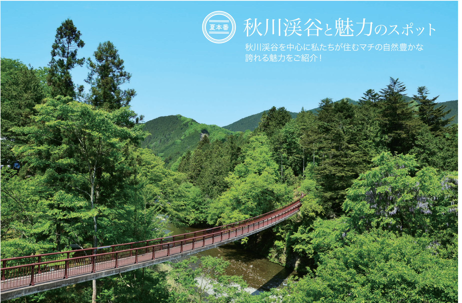
石舟橋 (いしぶねばし)

あきる野のランドマーク的な石舟橋。この付近から西側は、秩父多摩甲斐国立公園に指定されています。