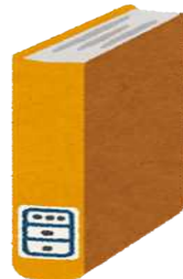
図書館蔵書数(令和5年度末) 市民1人当たり8.2冊