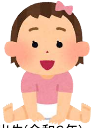
出生(令和6年) 1日に1.0人