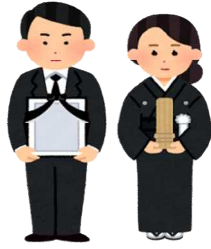
死亡(令和6年) 1日に3.2人