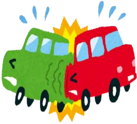
交通事故(令和5年) 1日に1.7件 (五日市・福生警察署管内)