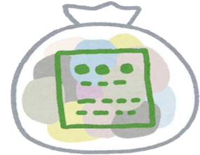
ゴミ(令和6年度) 1日に58.4t