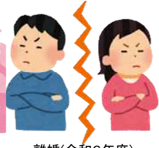
離婚(令和6年度) 1日に0.3組