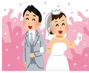
婚姻(令和6年度) 1日に0.7組