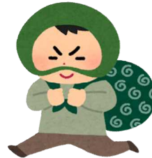
犯罪(令和6年) 1日に4.5件 (五日市・福生警察署管内)