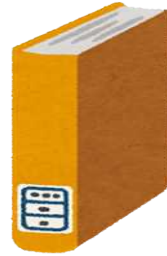
図書館蔵書数(令和6年度末) 市民1人当たり8.3冊