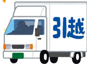
転出(令和7年) 1日に7.0人