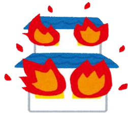
火災(令和6年) 1日に0.1件