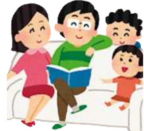
世帯員(令和8年1月1日) 1世帯当たり2.1人