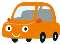
自動車保有台数(令和5年度末) 1世帯当たり0.8台