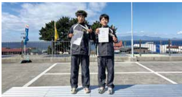
○問合せ スポーツ推進課スポーツ推進係(直通558-1262)