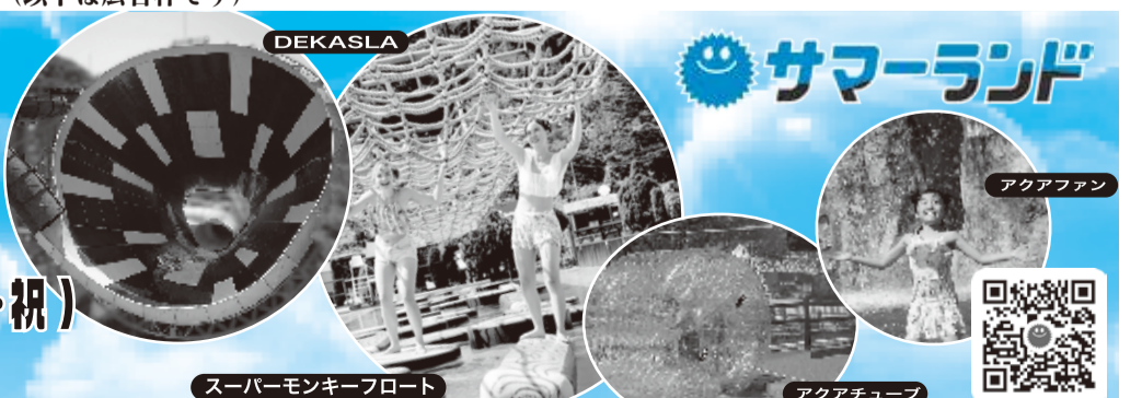
スーパーモンキーフロート

GW 限定 オープン 4/25(土)・26(日)・29(水・祝) 5/2(土)～6(水・祝)