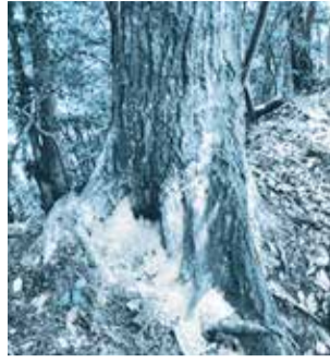
ナラ枯れ被害の樹木

カシノナガキクイムシ等を原因とするナラ枯れ被害の拡大を防止し、生物多様性を保全するため、ナラ枯れ対策に要する経費の一部を補助します。