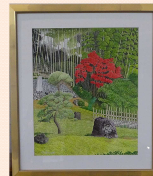
優秀賞 「秋の金松寺」