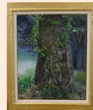
優秀賞 「桜若葉の頃」