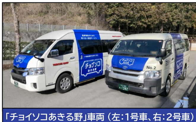
「チョイソコあきる野」車両 (左:1号車、右:2号車)

※ 予約時に車両の号車名(1号車・2号車)を控えるなど、乗車する車両を乗り間違えないよう、ご注意ください。