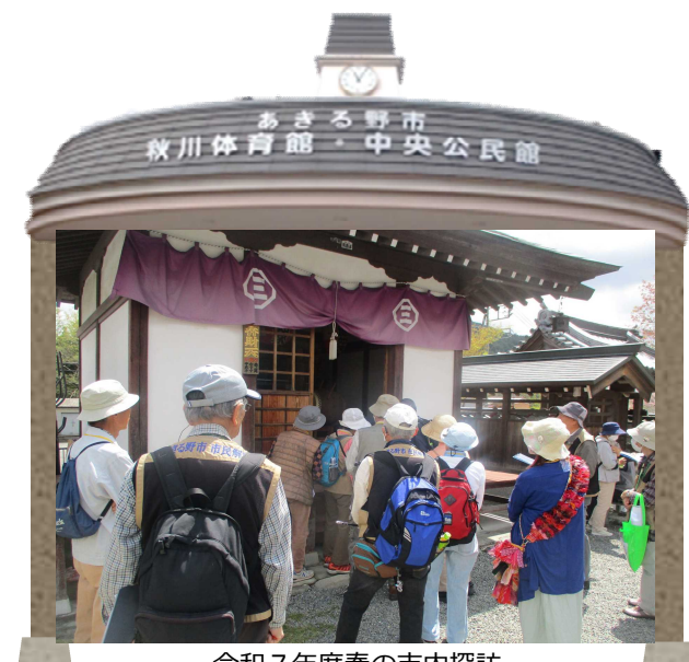
令和7年度春の市内探訪

「武蔵五日市駅周辺から伊奈坂上間の五日市街道の変遷と、秋川中流の奇岩や周辺の歴史を巡る」の様子