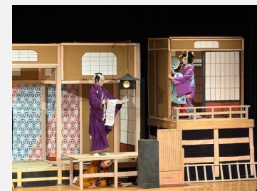
第28回(令和7年度)あきる野市民文化祭 催し物の部「秋川歌舞伎あきる野座」の様子

☎…5月7日(木)までに参加希望団体届出書(中央公民館で配付)に記入の上、申し込んでください。