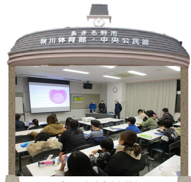
令和6年度青少年教室 「冬の星座講座と星空観望会」の様子