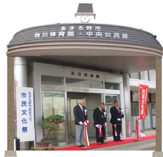
令和6年度市民文化祭「開会式」の様子