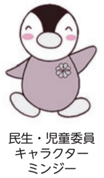
民生・児童委員キャラクターミンジ