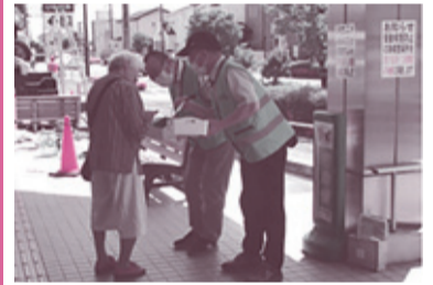
昨年度の啓発活動の様子