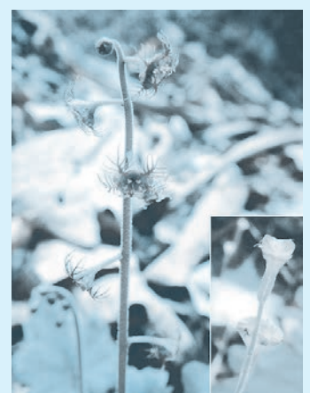
不思議な形をした花とチャルメラに似る果実

冬が極まり春の気配が立ち始める立春が過ぎ、野山では早春の花が見られる頃となりました。昨年(2023年)の記録だと、今月はウメやネコヤナギ、フクジュソウ、3月に入ると種類は徐々に増えていき、コブシ、ダンコウバイ、ミツマタ、そして春の花の代表とも言えるカタクリやアズマイチゲなどが美しく咲きました。その後、ヤマザクラやミツバツツジが野山を彩り春爛漫の4月となりました。一方、早春の花のイメージが強いホトケノザやオオイヌノフグリは、早いところでは11月に開花しました。秋期の気温が高かったことが影響したのでしょうか。また、昨年は春だけではなく年間を通して開花が少し早まった印象でした。今回紹介するのは、春爛漫の頃に山地の谷沿いに咲くチャルメルソウの仲間「コチャルメルソウ」です。チャルメルは木管楽器のチャルメラのことで、昔はラーメンの屋台で吹かれていたそうです。このチャルメラに果実の形が似ていることからこの名がつけました。森林レンジャー1年目に、自然資源発掘の目的で入った沢で花を初めて見た時は衝撃を受けました。若松文様に似た花びら、めしべを囲むように5つのおしべが均等に並ぶ不思議な形をした花は、何かの情報を集めるためのアンテナのように見えました。コチャルメルソウは、特定のキノコバエの仲間が受粉を助けていることが国立科学博物館の研究者によって解明されていて、花びらの形は細長い足を持つキノコバエがとまる足場としての役割があると考えられています。コチャルメルソウにとって、口一杯に花粉を付けて運んでもらうために必要な形だったので。私は、キノコバエが花びらに足をかけて吸蜜する姿を見たことがないため、今年は観察したいと思っています。また、このキノコバエの幼虫は、谷沿いに生育する特定のコケ類を食べて育つそうです。このコケ類が生育する湿潤な谷沿いの環境と、開花期にキノコバエが成虫となっていることが不可欠なコチャルメルソウのつながりを知ると、出会えた時の感動が何倍にも膨らみます。昨年の植物調査では、開花記録のほかに確認した植物種の記録を継続しています。中には、数十年ぶりの発見となった種や、残念ながら開花しなかった種もありました。今年も、様々な影響を受けて変化する自然の調査を継続し、保全や環境教育に役立てたいと思います。(加瀬澤)