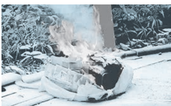
充電機搭載品が混入したごみが発火している様子

都内全域における充電機類が原因の発火件数は、直近5年間で約3倍に増加しています(東京消防庁ホームページ)。分別に迷う製品などがあれば、生活環境課へお問い合わせください。 ▽ 具体的な分別例(一例) ● 使用済小型電子機器の収集日に排出：電気シェーバー、電動歯ブラシ、電子書籍端末、デジタルカメラ、ビデオカメラなど ● 有害ごみの収集日に排出：充電機が取り外せない製品群(スマートフォン、充電機)