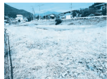
敷地内南東から撮影