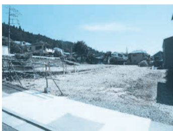
西側道路から撮影