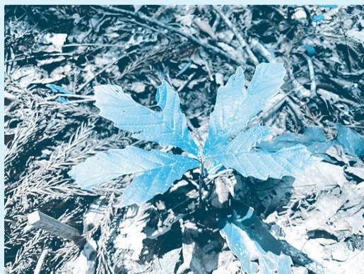
森林内に育つミズナラの稚樹

今年のどんぐりは不作であり、食べ物を求めて人里に出てくるクマが多くなる可能性があります。過去には、クマを人里に誘引した物として栽培品種のクリやカキ、キウイフルーツ、生ごみ、養蜂用の巣箱、放置された農作物、果実が入っていた空き箱などが報告されています。そのため、誘引物を取り除くことが野生動物と人の不要な接触を減らし、地域の暮らしを守ることに繋がりますので今年もご協力をお願いいたします。(加瀬澤)