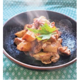
きなこを使い切る 鶏とジャガイモのきなこ煮

市内の家庭から出る可燃ごみの約9%が、未開封食品や食べ残しなどの食品ロスと推計されます。賞味期限切れを防ぎ食材を使い切ることを学び、美味しく食べきることを学び、美しく無駄にしないレシピの講習会を実施します。