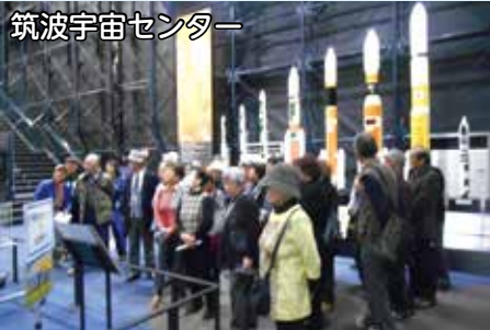
筑波宇宙センター