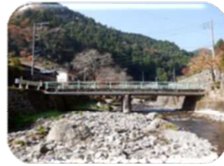
養沢川に架かる平和橋 昭和49年竣工

あきる野市の管理する橋梁は、一部竣工年が不明な橋梁もありますが、20年後には半数以上の橋梁が架設後50年を超えてしまいます。一般的な橋梁の耐用年数は50年程度で、事後的（損傷が進行してから対応）な修繕及び架け替えでは莫大な費用が必要になります。そこでより一層効率的・効果的な修繕に取り組むため、平成25年度に今後50年間の「長寿命化修繕計画」を策定しました。その後、今年度までに実施した定期点検の結果を基に「長寿命化修繕計画」の改定を行いました。