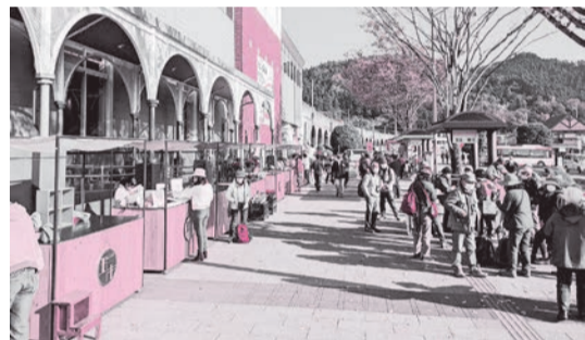
武蔵五日市駅前で実施されている五市マルシェ