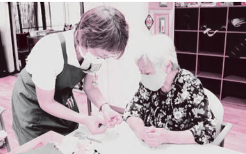
高齢者生きがいづくり活動