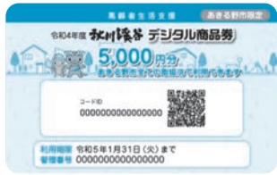
見本(実際のカードは、見本 と異なる場合があります)