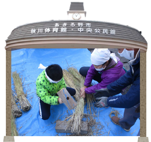
令和3年度市民大学伝統文化講座の様子 「お正月のしめ飾りを作ろう!」