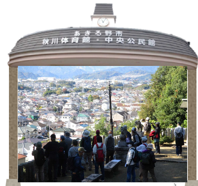
令和2年度市内探訪の様子