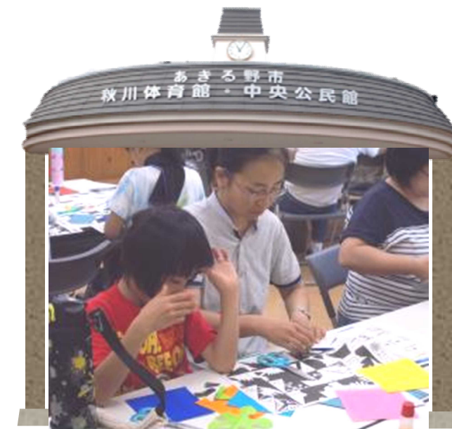
令和元年度青少年教室「科学教室」の様子