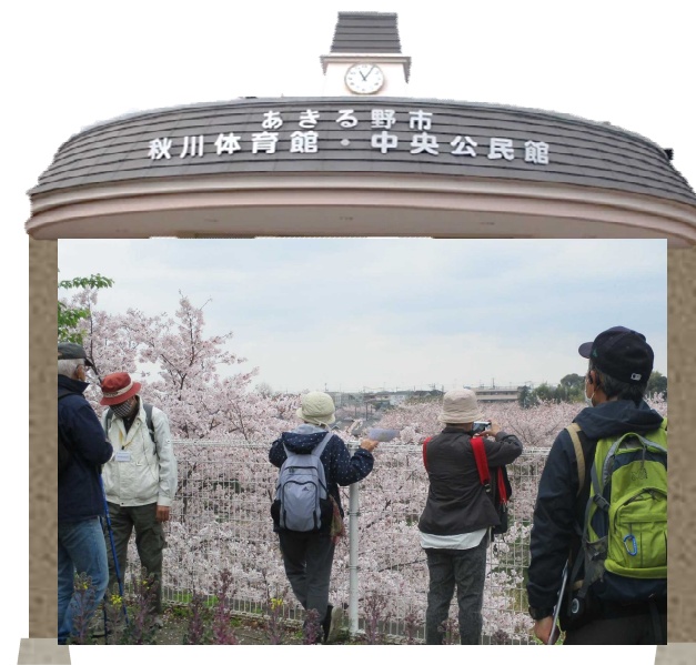
市内探訪春①コース「桜と湧水の平井川沿いを歩く」