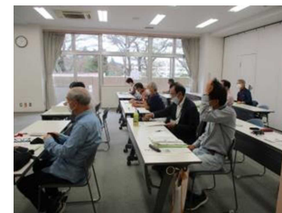
【令和2年度市民カレッジ入門講座】