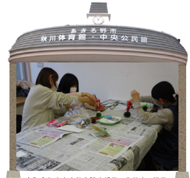
令和2年度家庭教育講座親子工作教室の様子 「ほっこりお家でクリスマス！」 ～親子で可愛い松ぼっくりリースを作ろう～