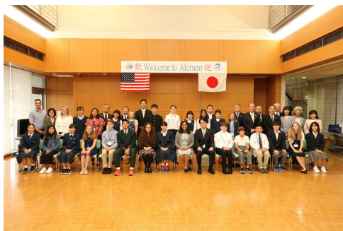
友好訪問団の歓迎会

しかしながら、新型コロナウイルス感染症の世界的な感染拡大により、令和2年度から今年度の派遣・受入事業を中止せざるを得ない状況となりました。