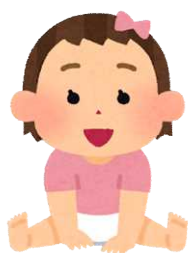
出生(令和3年) 1日に1.2人