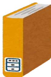
図書館蔵書数(令和2年度末) 市民1人あたり7.7冊