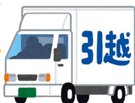
転出(令和3年) 1日に6.8人