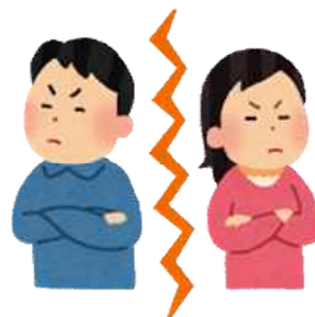
離婚(令和2年度) 1日に0.4組