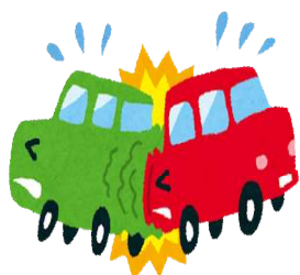
交通事故(令和2年) 1日に1.6件 (五日市・福生警察署管内)