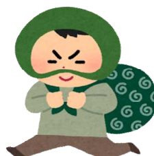
犯罪(令和2年) 1日に3.3件 (五日市・福生警察署管内)