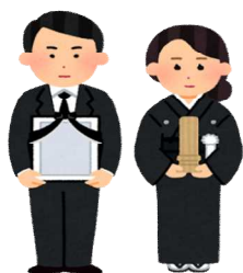
死亡(令和3年) 1日に2.7人