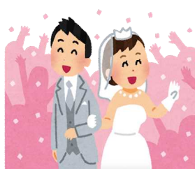
婚姻(令和2年度) 1日に0.6組