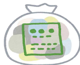
ゴミ(令和2年度) 1日に65.0t