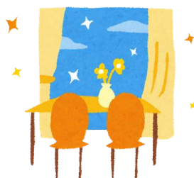
転入(令和3年) 1日に8.0人