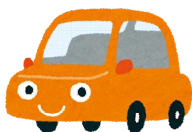
自動車保有台数(令和元年度末) 1世帯当たり0.8台