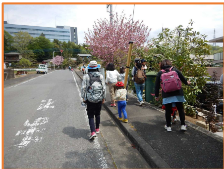
舗装された平坦な道。