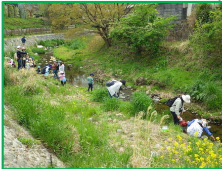
小石の多い平坦な道。川原に下りて水を触ってみる予定です。