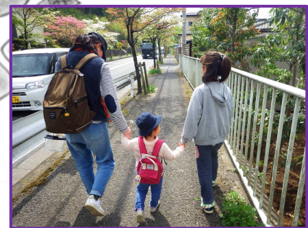
舗装された平坦な道。