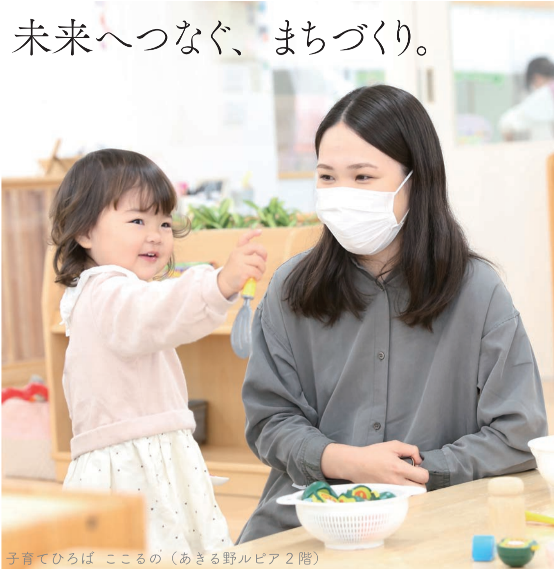
子育てひろば こころの (あきる野ルピア 2階)