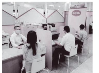
事業者向け特別相談窓口 (Bi@Sta)

観光の振興につきましては、新型コロナウイルス感染症の感染拡大により、人流が抑制される状況が続く中、観光協会等関連団体と連携し、マイクロツーリズムに着目したプロモーション活動やロケツーリズムのメニューを踏まえた取組を進めてまいります。