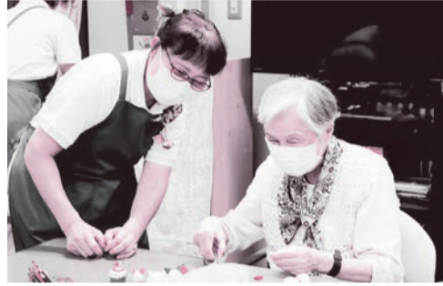
高齢者生きがいづくり活動

さらに、介護サービスを支える介護人材の確保が喫緊の課題であることから、引き続き、専門的研修を実施するとともに、介護人材の確保・定着・育成に向け、補助事業を実施してまいります。