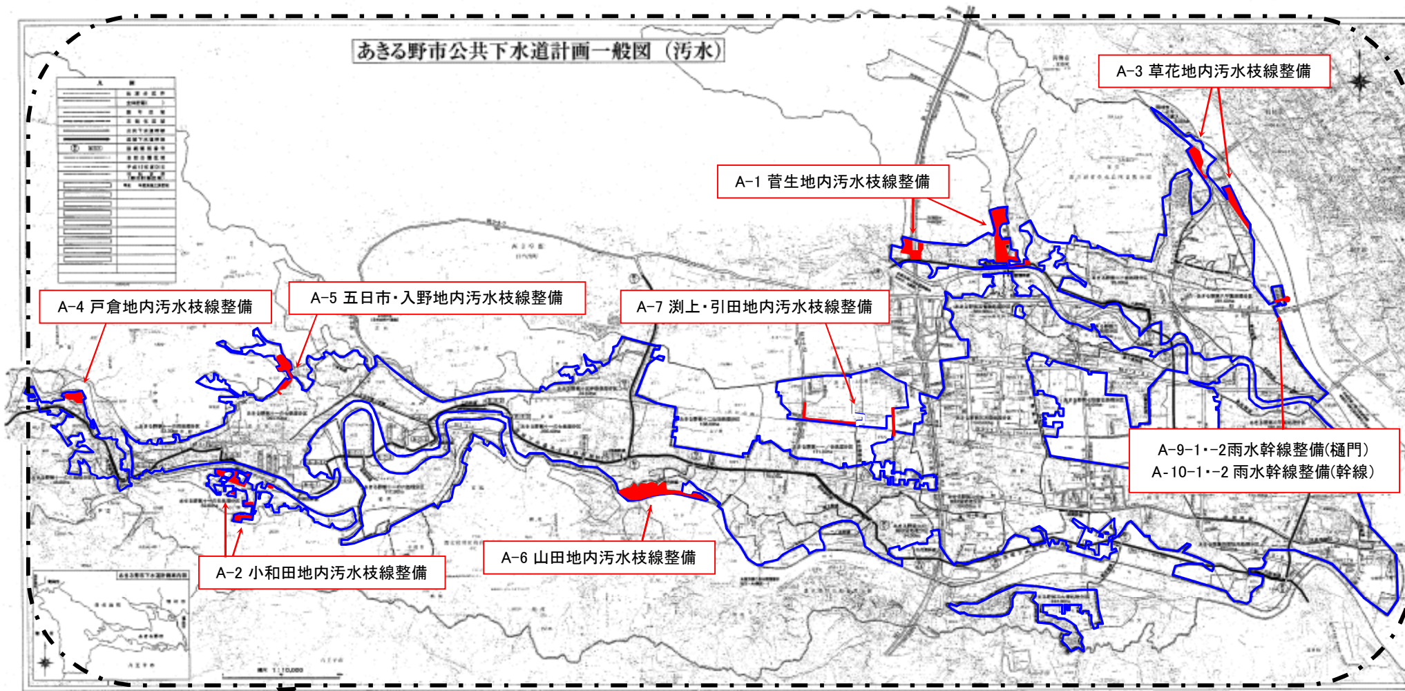
あきる野市公共下水道計画一般図(汚水)