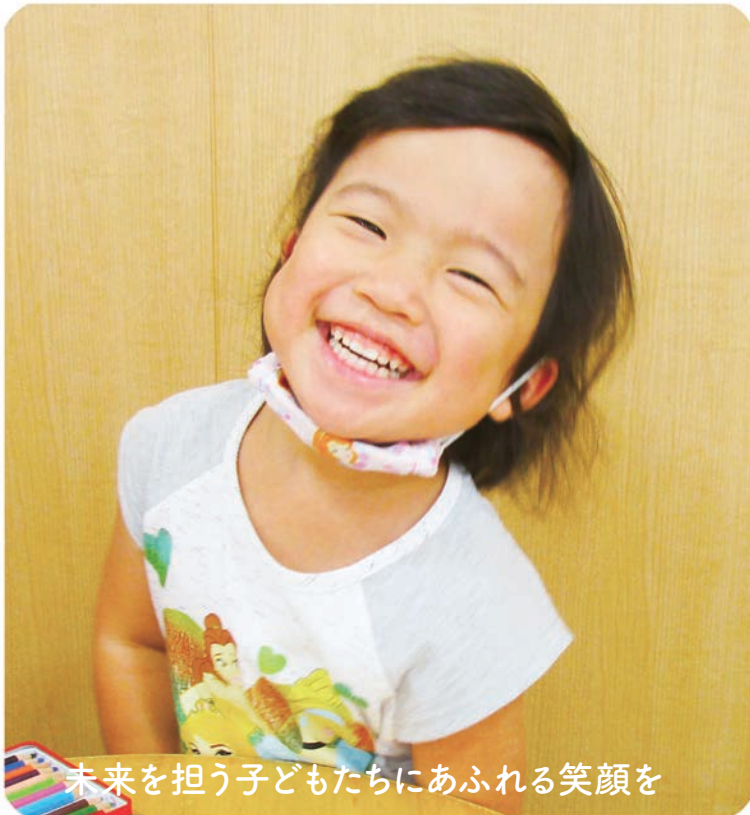
未来を担う子どもたちにあふれる笑顔を

市では、子ども・子育て家庭が社会全体に見守られ安全に安心して暮らせる環境の整備などを基本目標に、児童虐待の発生予防・早期発見、発生時の迅速・的確な対応等を行っています。