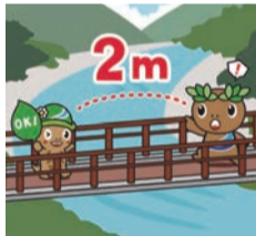
ソーシャルディスタンスの確保