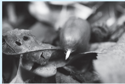
乾燥しないように根を張って冬を越すため発根し始めたミズナラ

実ったどんぐりが地面に落下した後、紅葉の時季を迎えます。1年を通して青々とした針葉樹林と美しく紅葉した広葉樹林を眺めて、野生動物が暮らす環境について考えを巡らせてくださる方が少しでも増えることを願います。(加瀬澤)