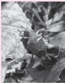
ヒメハサミツノカメムシ

ヒメハサミツノカメムシのハサミは飾りではなく、交尾の際にメスの体を挟み込み、体を固定させるために使うそうです。しかし、肩のトゲの使い道は分かりません。このように色々な装備を備えたカメムシですが、その匂いは試さなかったので全く分かりません。もしかしたら強烈だったかもしれません。