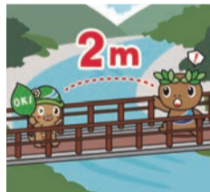
ソーシャルディスタンスの確保