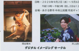
デジタルイメージングサークル