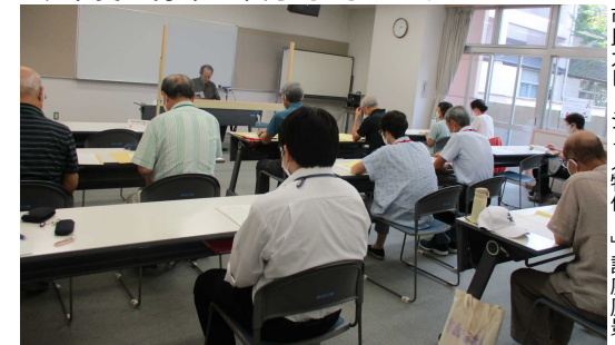
市民カレッジ「人物伝Ⅱ」講座風景