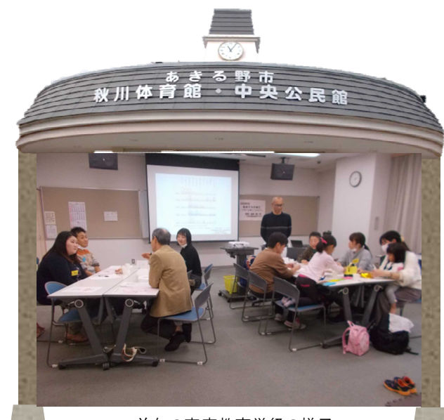
前年の家庭教育学級の様子