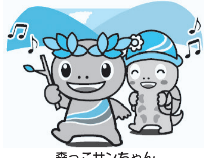
森っこサンちゃん

JR武蔵増戸駅から横沢入天竺山を経て、JR武蔵五日市駅までのルートを歩き、春の里山や地域の方が行っている森や山のための活動などを知るツ