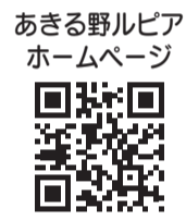
あきる野ルピア ホームページ

※詳しくは、ホームページをご覧ください。 ※電話か窓口で申し込んでください。(午前10時〜午後6時受付)