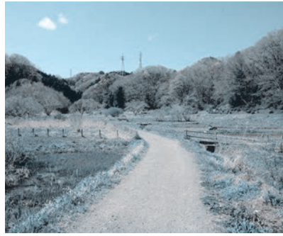
横沢入里山保全地域

季節は春、冷たさのゆるむ水の中にはカエルの卵やオタマジャクシが泳いでいます。今回は、水の中の生き物を中心に、春浅い里山の生き物を観察します。生き物を通して、春の訪れを感じてみましょう。