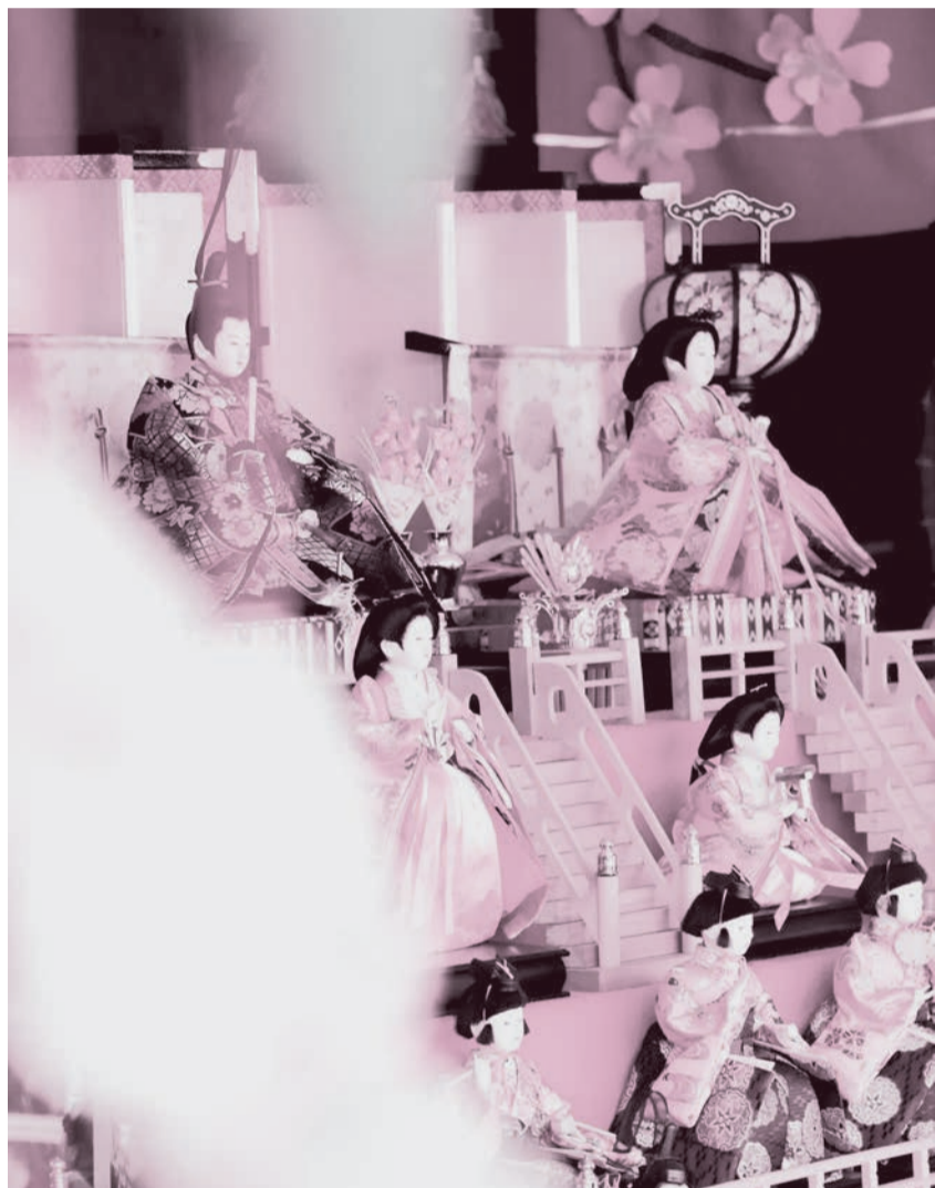
※詳しくは、市ホームページやFacebookでご確認ください。

五日市地区・増戸地区の各家庭や商店に伝わる大切な雑沓人形やつるし雑などがご覧いただけます。 ※各店舗を巡り、抽選で景品が当たるスタンプラリーは緊急事態宣言の解除後から実施する予定です。 ※「箏のしらべ」は、緊急事態宣言が延長された場合、中止することがあります。 ※主催…五日市活性化戦略委員会