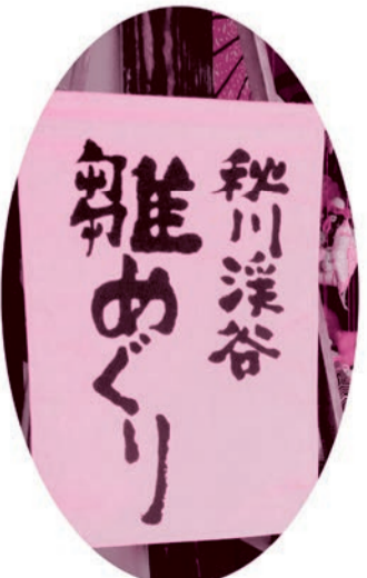
※この旗が目印です。

〇日時やイベントなどの問合せ 商工振興課商工振興係(直通558-1893 土曜・日曜日、祝日休み)、五日市観光案内所 [☎596-0514 (水曜日休み)]