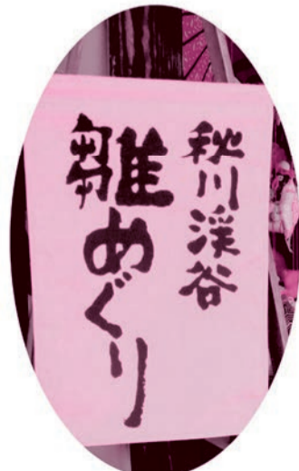
※この旗が目印です。

〇日時やイベントなどの問合せ 商工振興課商工振興係(直通558-1893 土曜・日曜日、祝日休み)、五日市観光案内所[☎596-0514(水曜日休み)]