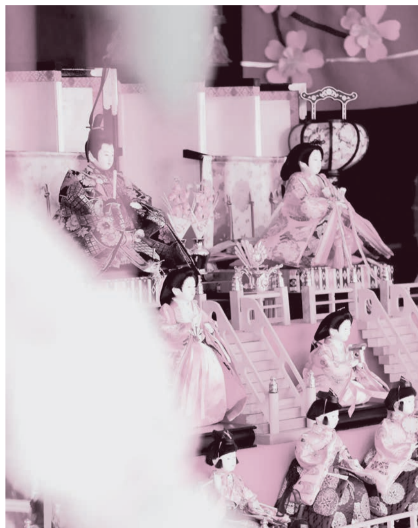
※詳しくは、市ホームページやFacebookでご確認ください。

五日市地区・増戸地区の各家庭や商店に伝わる大切な雛人形やつるし雛などがご覧いただけます。 ※各店舗を巡り、抽選で景品が当たるスタンプラリーは緊急事態宣言の解除後から実施する予定です。 ※「箏のしらべ」は、緊急事態宣言が延長された場合、中止することがあります。 ※主催…五日市活性化戦略委員会