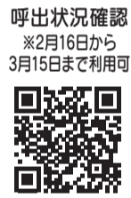
呼出状況確認 ※2月16日から3月15日まで利用可

二テイホールの申告会場のみ) 呼び出し状況をリアルタイムで確認することができません。また、入場整理券に2次元コードが印刷されていますので、スマートフォンなどから呼出状況を確認することができます。 ▽マスク着用の確認と検温を実施します 添付資料はご自宅で作成してください 申告会場での飛沫防止及び滞