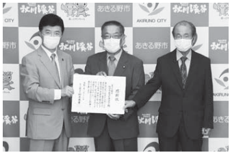
町内会・自治会連合会では、

昨年の台風19号による市内の被災に対し、被災された会員に少しでも寄り添い支援ができればとの思いから募金活動を行い、300万円を超える寄付金が集まり、被災の程度に応じて被災世帯に見舞金を贈呈しました。また、復旧・復興の取組を行う市へ台風災害支援金として約35万円を寄附していただきました。このような貢献に対し感謝状を贈呈しました。