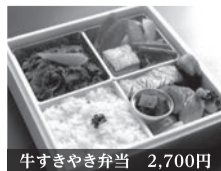
牛すきやき弁当 2,700円