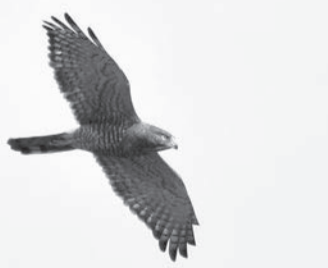
あきる野で繁殖していたサシバ (2015年撮影)

猛きん類は、生物生態系の頂点に立つ存在として、カラス、ハト、ムクドリなどの鳥類や哺乳類などの増加を抑える重要な捕食者です。しかし、これまでに営巣場所の破壊や密猟などにより、人間は猛きん類を追い詰め、数を減らしてしまいました。そして、現代の環境問題も上乗せし、生息が危機的状況にある種類もいます。このため、日本に限らず世界でも猛きん類に対する保全の優先順位はトップレベルとされています。私があきる野の重要な猛きん類の調査や保全活動を始めて10年になりますが、2018年は記憶に残る残念な繁殖結果になりました。これまで調べてきたクマタカやオオタカ、サシバなどの重要な猛きん類の全てのつがいの繁殖が失敗しました。まれな出来事であってほしいと思いましたが、生息状況は一貫して悪化傾向を示し、今年も2018年に近い結果になってしまいました。特に心配される夏鳥のサシバは、2018年に続き、翌年も繁殖に失敗しました。ほ乳類による巣への侵入が原因とみられます。そして今年、市内で繁殖していた同じつがいは、例年どおり飛来しましたが、約1か月で行方不明になり、繁殖は確認できませんでした。通常、水田などの開放的な環境で獲物を狩るサシバですが、西多摩エリアでは徐々にそのような狩場が無くなってきています。営巣をあきらめてしまう原因を考えると、東京の里山の環境悪化が進んでいることを改めて実感します。トウキョウサンショウウオなどと並び、里山の環境の代表者であるサシバが、あきる野から姿を消したことにより、今後は子育てが見られる可能性は低いと推測しています。東京で繁殖する最後のサシバのつがいの可能性もあるため、重大な出来事であると思っています。私自身、その保全に力不足だったことが無念でなりません。自然に関心が高まっている時代であるにもかかわらず、複雑で難しい環境問題が多く、悪循環が相次ぐ中で絶滅危惧種の絶滅カウントダウンが続いています。(パブロ)