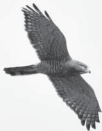
あきる野で繁殖していたサシバ (2015年撮影)

猛きん類は、生物生態系の頂点に立つ存在として、カラス、ハト、ムクドリなどの鳥類や哺乳類などの増加を抑える重要な捕食者です。しかし、これまでに営巣場所の破壊や密猟などにより、人間は猛きん類を追い詰め、数を減らしてしまいました。そして、現代の環境問題も上乗せし、生息が危機的状況にある種類もいます。そのため、日本に限らず世界でも猛きん類に対する保全の優先順位はトッパレとされています。私があきる野の重要な猛きん類の調査や保全活動を始めて10年になりますが、2018年は記憶に残る残念な繁殖結果になりました。これまで調べてきたクマタカやオオタカ、サシバなどの重要な猛きん類の全てのつがいの繁殖が失敗しました。まれな出来事であってほしいと思いましたが、生息状況は一貫して悪化傾向を示し、今年も2018年に近い結果になってしまいました。特に心配される夏鳥のサシバは、2018年に続き、翌年も繁殖に失敗しました。ほ乳類による巣への侵入が原因とみられます。そして今年、市内で繁殖していた同じつがいは、例年どおり飛来しましたが、約1か月で行方不明になり、繁殖は確認できませんでした。通常、水田などの開放的な環境で獲物を狩るサシバですが、西多摩エリアでは徐々にそのような狩場が無くなっていきます。営巣をあきらめてしまう原因を考えると、東京の里山の環境悪化が進んでいることを改めて実感します。トウキョウサンショウウオなどと並び、里山の環境の代表者であるサシバが、あきる野から姿を消したことにより、今後は子育てが見られる可能性は低いと推測しています。東京で繁殖する最後のサシバのつがいの可能性もあるため、重大な出来事であると思っています。私自身、その保全に力不足だったことが無念でなりません。自然に関心が高まっている時代であるにもかかわらず、複雑で難しい環境問題が多く、悪循環が相次ぐ中で絶滅危惧種の絶滅カウントダウンが続いています。(パブロ)