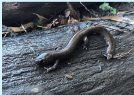
市内に生息するトウキョウサンショウウオ。近年、個体数が増加傾向にある場所があります。

市のイメージキャラクターの元になったトウキョウサンショウウオは、主に80年代からの環境の悪化や消失、外来種による影響を受け、個体数が激減してしまった貴重な両生類です。今では少しずつ関心が集まり、トウキョウサンショウウオをはじめとする両生類や水生生物の保護のために活動する団体なども増え、徐々に生息環境の確保や個体数の復活に至っている場所もあります。しかし、外来種問題の他にも、盗卵などの密漁の影響が目立ち、対策の強化が求められてきたため、環境省は、絶滅危惧種に指定されているトウキョウサンショウウオを新たに特定第二種国内希少野生動植物種に指定しました(令和2年2月)。これにより、販売や頒布を目的とした採取(生体・卵囊とも)は禁止され、違反すると罰則があります。