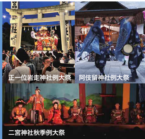
正一位岩走神社例大祭