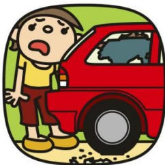
交通事故(平成27年) 1日に2.7件 (五日市・福生警察署管内)