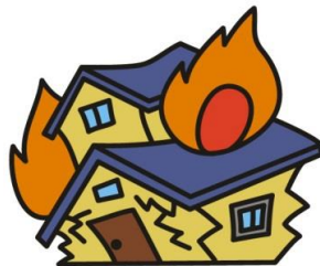
火災(平成27年) 1日に0.1件