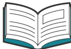
図書館蔵書数(平成27年度末) 市民1人あたり6.9冊