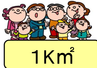
人口密度(平成29年1月1日) 1Km 2 あたり1,110人