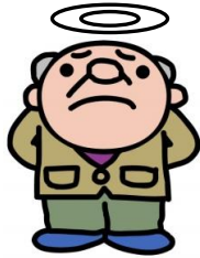
死亡(平成28年) 1日に2.6人