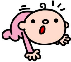
出生(平成28年) 1日に1.4人