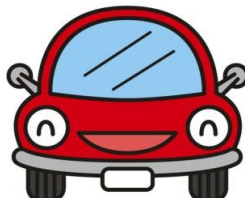
自動車保有台数(平成26年度末) 1世帯当たり0.9台