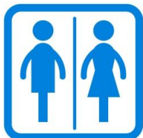
し尿(平成27年度) 1日に16.2kl