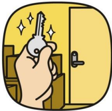
転入(平成28年) 1日に8.7人