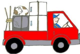
転出(平成28年) 1日に7.7人