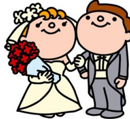
婚姻(平成27年度) 1日に0.9組