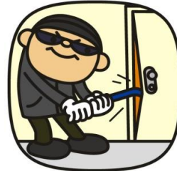
犯罪(平成27年) 1日に6.5件 (五日市・福生警察署管内)