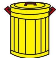
ゴミ(平成27年度) 1日に65.3t