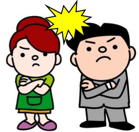
離婚(平成27年度) 1日に0.5組