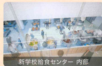
新学校給食センター 内部