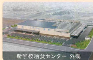
新学校給食センター 外観

新学校給食センターが完成すると、アレルギー対応給食も提供できるようになり、災害時の食の拠点が図られるなど、一層の充実が期待されています。