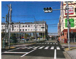
旧あきる野とうきゅう前