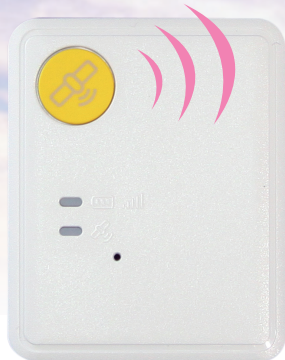
原寸大 (縦47.5mm 横38.5mm 厚さ11.85mm)

GPS機能(人工衛星による測位システム)のついた機器を貸し出し、認知症高齢者等の行方が分からなくなってしまったときに、電話やインターネット(パソコン・携帯電話等)で位置情報を提供するサービスです。