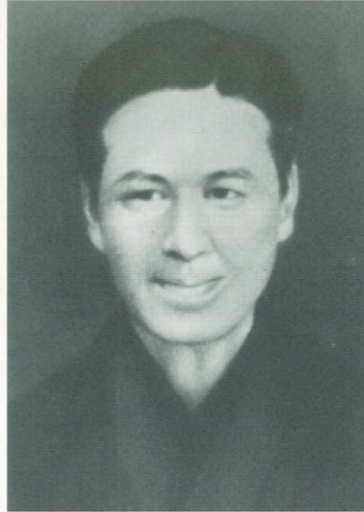
千葉卓三郎の肖像画

嘉永5年(1852年)仙台藩士の子として生まれる。17歳で戊辰戦争に参加して敗北。様々な思想遍歴を経て、五日市勸能学校の教員となる。自由民権運動に積極的に参加し、五日市憲法草案を起草する。明治15年(1882年)結核が進行し、療養をはじめが同16年(1883年)31歳で亡くなった。