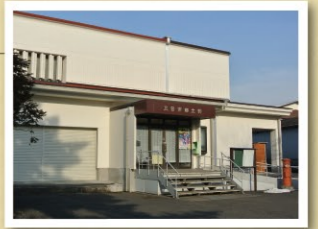
あきる野市五日市 920 番地 1 042-596-4069 9時30分~16時30分 月曜日(祝日の場合は翌日)、年末年始(12月27日~1月4日)

五日市地域の里のくらし、川のくらし等の様子をはじめ、黒八丈関係資料や考古資料を展示している。五日市憲法草案の関係資料である学芸講談会の開催通知や討論の題目を記したノートなど貴重な品々を見ることができる。