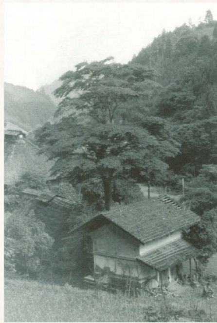
憲法草案発見当時(1968年)の深澤家土蔵

当時の私擬憲法草案の中でも条文が非常に多く、国民の権利を守る規定にその多くを割いていること、五日市地域の有力者や若者たちを中心に学習結社「五日市学芸講談会」を組織し、憲法に関する討論会や学習会を実施するなど、憲法草案起草に至るまでの経緯が分かることなどが評価され、東京都の有形文化財にも指定されている。