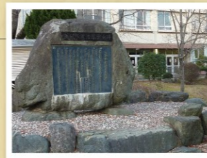
あきる野市五日市 400 番地

「五日市憲法草案」を後世の人々に広く知ってもらうため、千葉卓三郎生誕地の宮城県志波姫町(発見当時、現在の栗原市)、活躍の地である五日市町(現在のあきる野市)、墓所のある仙台市(資福寺)の3か所に同時に設置された。