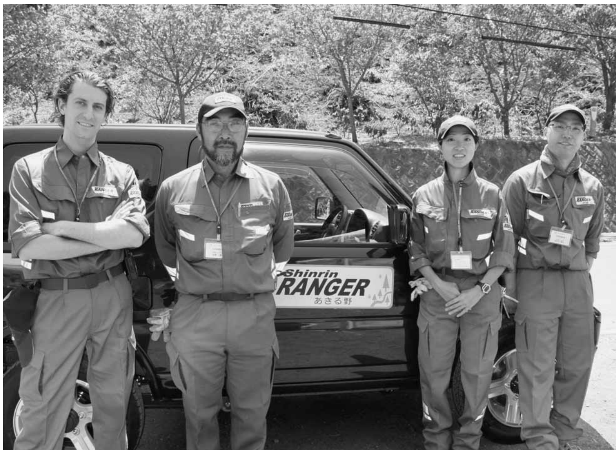
森林レンジャーあきる野

発行／あきる野市議会 編集／議会報編集特別委員会 TEL 558-1111 〒197-0814 あきる野市二宮350