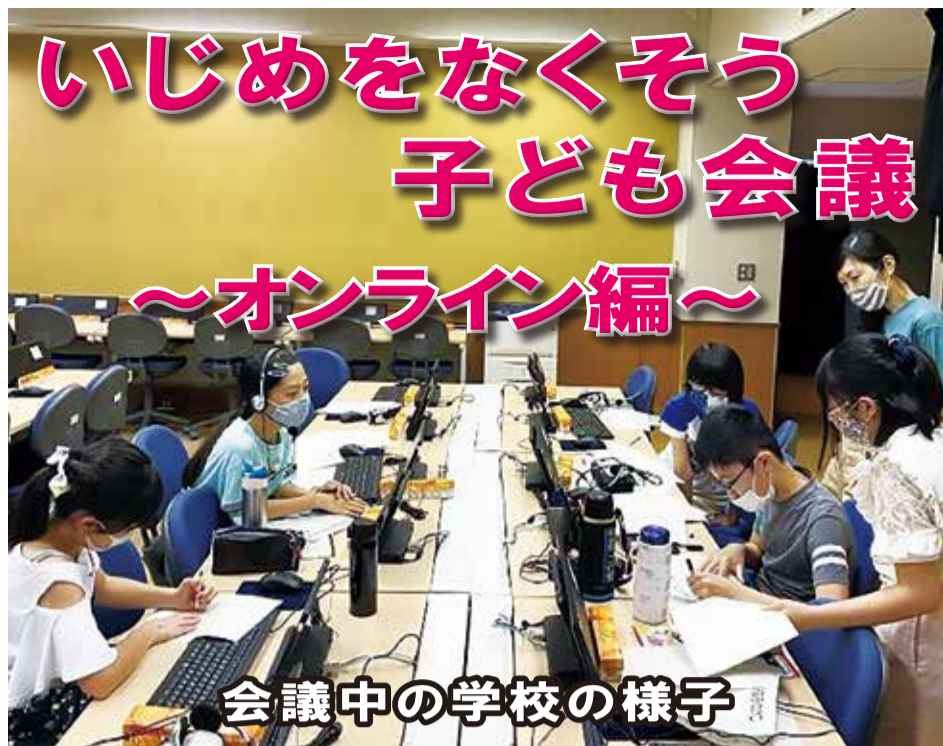
会議中の学校の様子