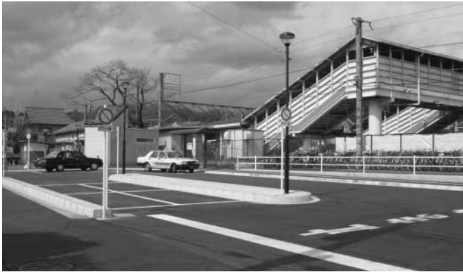
整備が進む武蔵増戸駅前

主要な市道整備につきましては、秋3・5・2号線整備事業の合意形成を進めていくとともに、整備方針などについて東京都と協議してまい