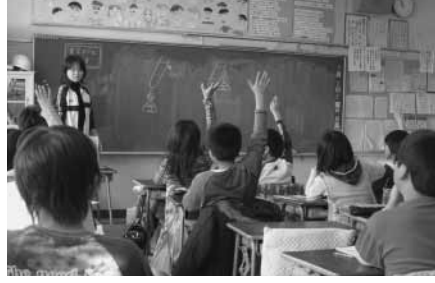
小学校の授業風景

平成18年12月に改正された教育基本法の施行に伴い、関係法令の改正が検討されており、また、本年1月には、内閣に設置された教育再生会議が、義務教育の抜本的な改革・改善の方向を提言いたしました。 このような中で、子どもたちには、心身ともに健康で、豊かな人間性と未来をひらく学力をはくむ教育を行うてまいります。家庭・学校・地域社会がそれぞれの役割と責任を自覚し、緊密な連携のもとに、安全で安心できる教育環境整備に努めながら、「人が育ち、人が輝くあきる野の教育」を推進してまいります。