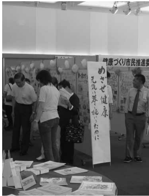
健康づくり事業風景

健康づくり事業では、多くの市民がかかわり、2年間検討してまいりました「めざせ健康あきる野21計画」が策定の運びとなりました。目標である「ふれあい生きがい 元気なまち」日々の生活の中で健康を育もう」を指針として、市民の健康増進に向けて事業を実施してまいります。 健康づくりは、市民一人ひとりが健康の大切さを自覚し、自らが実践することが求められることから、健康づくりの意識を全市に広げるため、誰もが取り組みやすい事業として「ウォーキング」をテーマに展開してまいります。 また、保健事業では、医療機関などの協力を得て、予防接種や母性および乳幼児の健診、健康の保持および増進、市民健康診査、がん検診、健康相談などに取り組んでまいります。