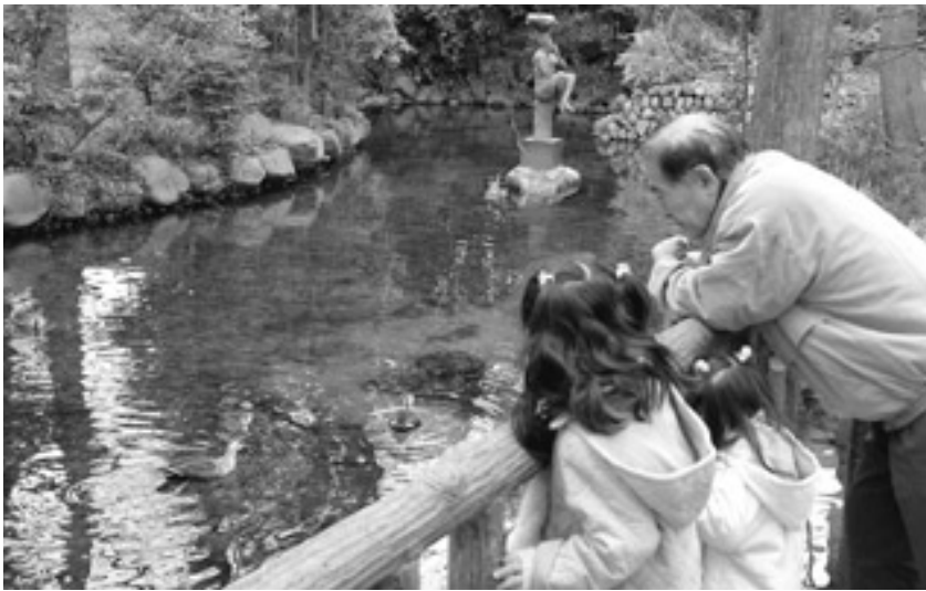
具体例 推薦する場所...二宮神社のお池 推薦理由...湧水でできた池で、常に豊かな水量を保ち、地元の皆さんの努力もあって、とても美しい場所となっています。

市内には、緑豊かな山々や清流秋川、横沢入の里山など、まだまだ多くの自然があり、貴重な動植物が生息し、美しい街並みや優れたデザインの建造物、歴史上価値のある建造物も存在しています。環境基本計画の取組の1つとして、市にとって自慢となる、未来の子どもたちにも残したい「おらがまちの自慢の場所」を募集します。 募集期間 2月29日(金)まで(消印有効) 応募場所の条件(例) 素晴らしい景観 素晴らしい景観 貴重な動植物が生息している 歴史上価値があるまたは美しいデザインの建造物 自由に発想してください。 応募方法 写真2枚以内を添付し(写真がなくても可)、次の方法で応募箱へ投函:市役所と五日市出張所に設置(応募用紙あり) 郵送または持参:応募用紙が、応募用紙と同じ内容(応募日、郵便番号、住所、氏名、電話番号、推薦する場所・理由)を用紙に記入 電子メール:応募用紙と同じ内容を記載し、件名を「おらがまちの自慢の場所」として、画像データを添付 1人何件でも応募可 写真はお返ししません。 その他 応募されたものは、あきる野市環境委員会審査し、「あきる野百景」として決定します。 選定場所の公開などは、環境保護の観点から、土地所有者の了解や環境保護に支障のない範囲とします。 市ホームページにも、記事を掲載しています。 応募・問合せ 環境課 環境・緑化係(〒197-0814 二宮350、内線2514、koono1@city.akiruno.tokyo.jp)へ